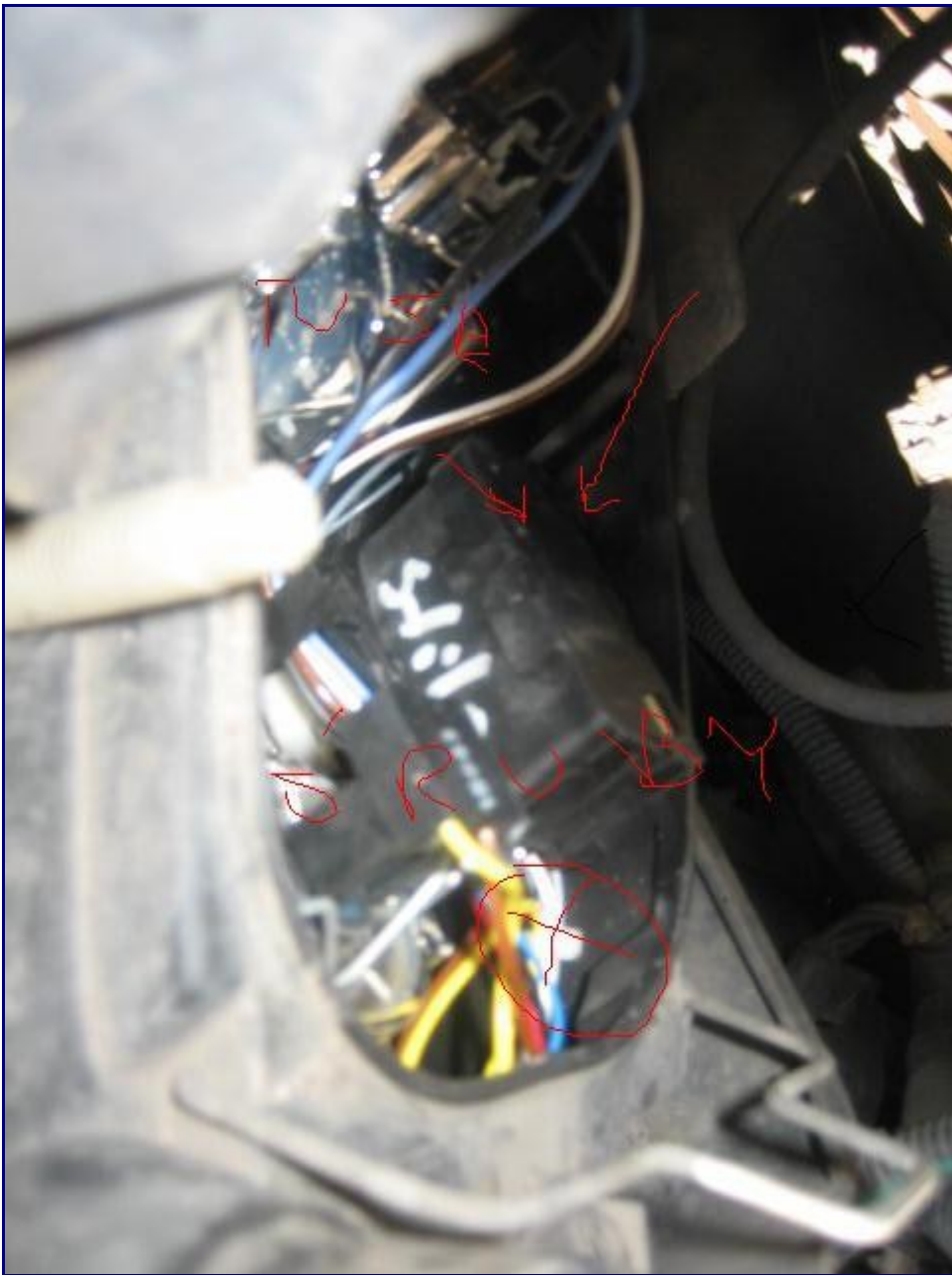
wyjęcie silniczka z jkego miejsca