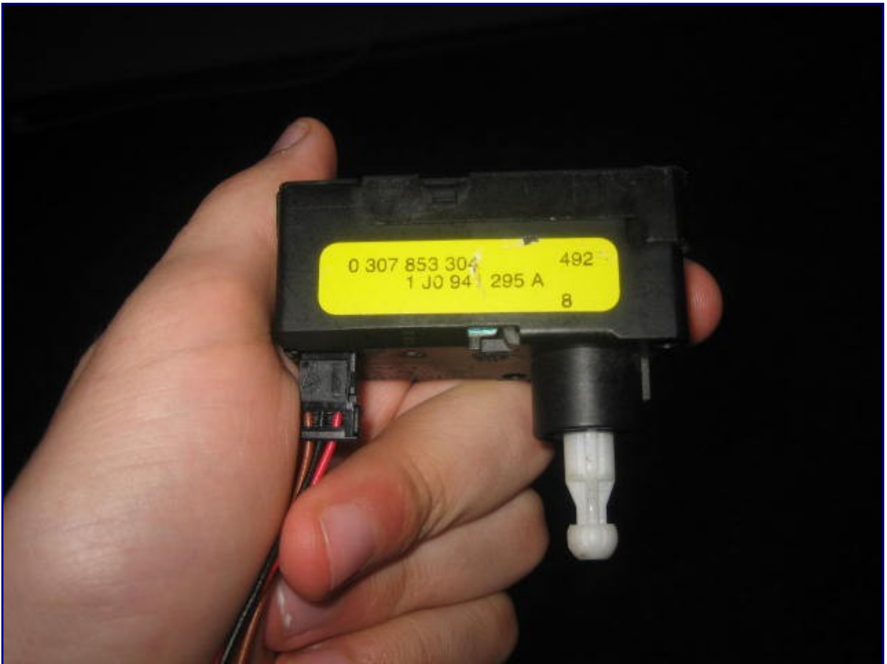
przed otwarciem klapki